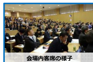
会場内客席の様子