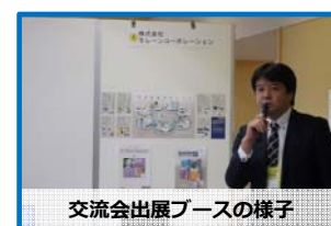
交流会出展ブースの様子