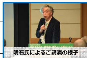
明石氏によるご講演の様子