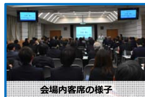
会場内容席の様子

交流会では、発表いただいた医療者と参加者による名刺交換、および情報交換が活発に行われました。HUB機構シーズデータベースに登録されている企業の製品、技術情報のリスト配布を通じて、各社の製品、技術をご紹介いたしました。次回以降も交流会を開催し、臨床機関の医療者にご参加される団体様、企業様との間での意見交換の場として、ご活用していただく予定です。