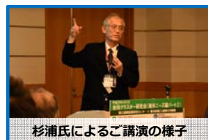
杉浦氏によるご講演の様子