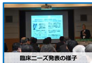
臨床ニーズ発表の様子