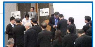
発表後の名刺交換の様子