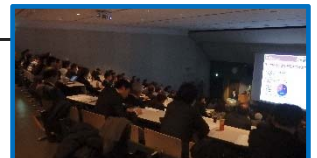
会場内客席の様子