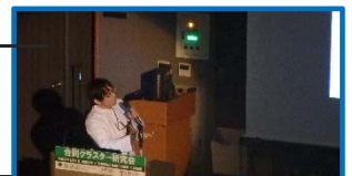
医療者による発表の様子

次回は、国立国際医療研究センターとの合同クラスター研究会(海外編パート2)を2017年2月3日(金)に開催します。どうぞご参加ください。