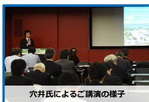
穴井氏によるご講演の様子