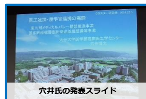
穴井氏の発表スライド