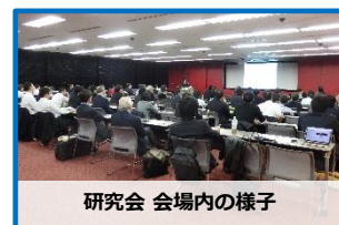
研究会 会場内の様子

2名の講師をお招きし、臨床ニーズを起点とした医療機器開発に関する最新の動向、具体的な実践事例について、基調講演及び医工連携実践講演を実施していただきました。