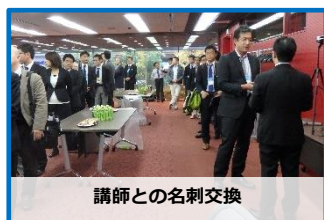
講師との名刺交換

交流会では、ご参加いただいた製販企業、ものづくり企業、行政・支援機関など関係機関、そしてご講演された2名の講師とを交えての名刺交換、および情報交換が活発に行われました。