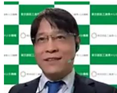
イントロダクション