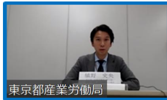
東京都産業労働局