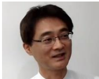
臨床ニーズ発表の様子