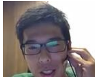
臨床ニーズ発表の様子