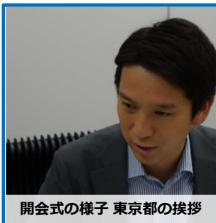
開会式の様子 東京都の挨拶