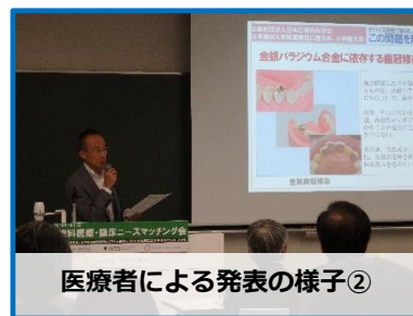
医療者による発表の様子②