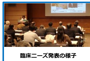
臨床ニーズ発表の様子