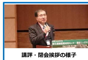
講評・閉会挨拶の様子