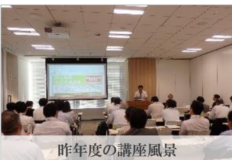
昨年度の講座風景

本講座を通じて、医療機器産業への新規参入や事業拡大に向けて、キーパーソンとのネットワークを構築し、業界を俯瞰しながら新しいビジネスの機会を検討できるような人材の育成にご関心のある企業の皆様は、是非ご参加ください。※全10回のうち、8回以上の講座に参加された皆様には修了書をお渡します。