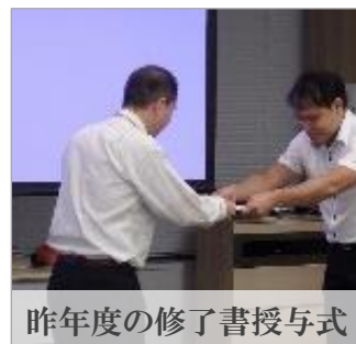
昨年度の修了書授与式