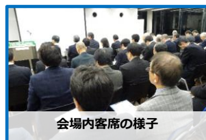
会場内客席の様子

糖尿病・代謝内科より1名の医療者が登壇し、計3テーマについて発表いただきました。