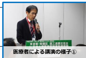
医療者による講演の様子①