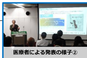
医療者による発表の様子②