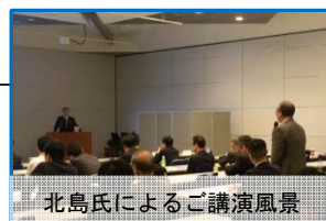
北島氏によるご講演風景