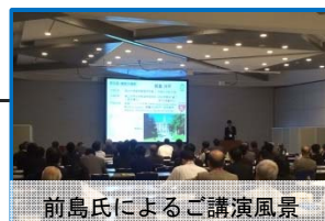
前島氏によるご講演風景