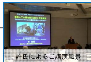
許氏によるご講演風景